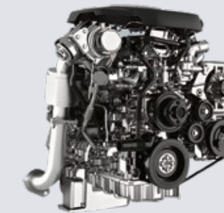
1.9 Ddi Blue Power Gen 2

• เกียร์อัตโนมัติ 6 สปีด พร้อมโหมด Rev Tronic และ Sequential Paddle Shift ถ่ายทอดจังหวะเปลี่ยนเกียร์ได้เร็ว และสิ้นไหม