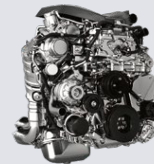
3.0 Ddi Blue Power