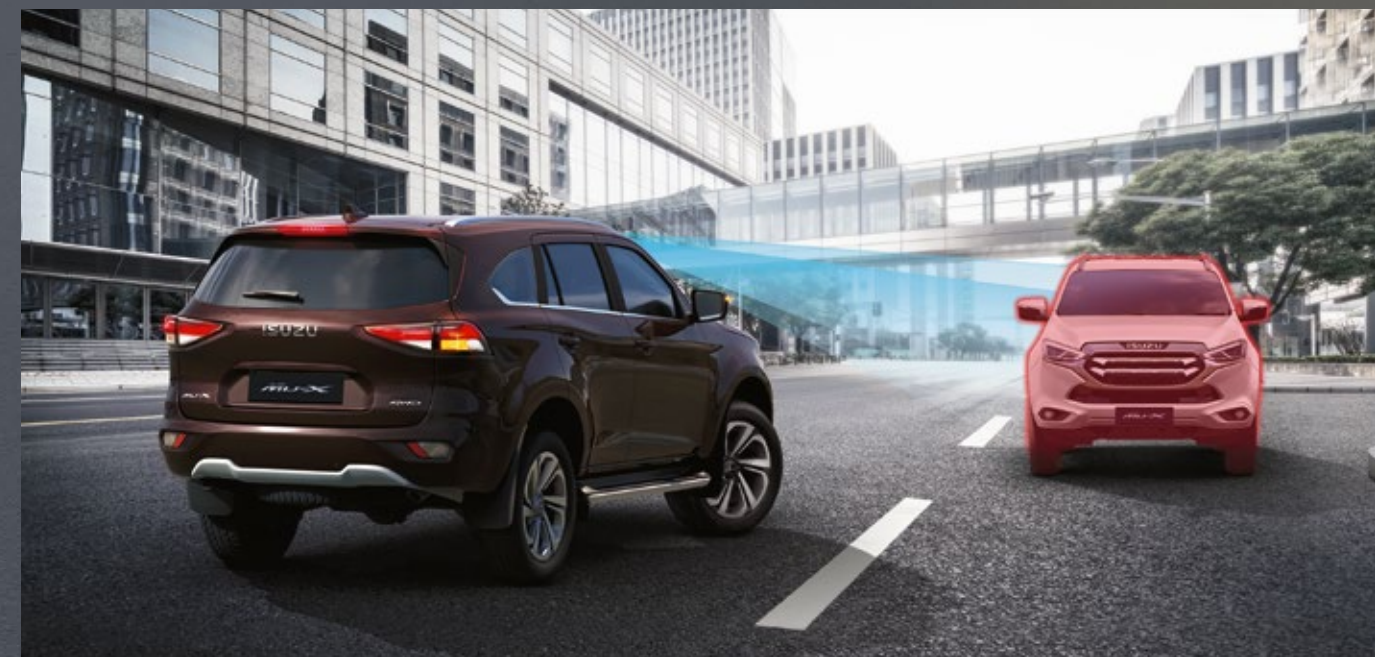
• ใหม่! Turn Assist with AEB ระบบช่วยเบรกรถฉุกเฉินอัตโนมัติเมื่อมีรถสวนทางขณะเลี้ยวขวา

ยกระดับความมั่นใจให้ทุกช่วงเวลา ก้าวล้ำสู่อีกขั้นแห่งความมั่นใจที่ครบครันกว่า ด้วยเทคโนโลยี เพื่อความปลอดภัยล้ำหน้าล่าสุดจาก ALL-NEW ISUZU MU-X เสริมความมั่นใจยิ่งกว่าตลอดทุกเส้นทางที่ขับขี่